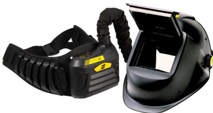
F20 Air med ESAB EPR-X1 PAPR